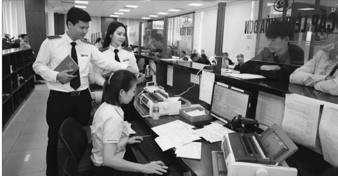
Việc xác định trọng yếu và đánh giá rủi ro sẽ giúp nâng cao chất lượng và hiệu quả của hoạt động kiểm toán

Việc xác định trọng yếu và đánh giá rủi ro sẽ giúp nâng cao chất lượng và hiệu quả của hoạt động kiểm toán. Tuy vậy, thực tiễn áp dụng phương pháp này thời gian qua đã đặt ra một số yêu cầu đối với đoàn kiểm toán cũng như các kiểm toán viên (KTV) trong công tác chuẩn bị và lập kế hoạch kiểm toán.