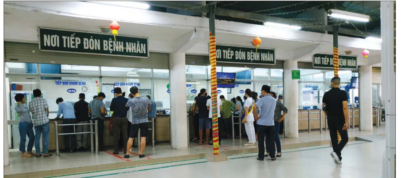
Việc thực hiện Đề án Bệnh viện vệ tinh của ngành y tế đã đem lại nhiều kết quả tích cực

Thời gian qua, việc thực hiện Đề án Bệnh viện vệ tinh của ngành y tế đã đem lại nhiều kết quả tích cực, góp phần tạo đột phá trong việc nâng cao năng lực, chất lượng khám, chữa bệnh cho y tế tuyến dưới, giảm quá tải cho bệnh viện tuyến trên, đồng thời tạo thuận lợi, tiết kiệm chi phí cho người dân khi được khám, chữa bệnh ngay tại địa phương.