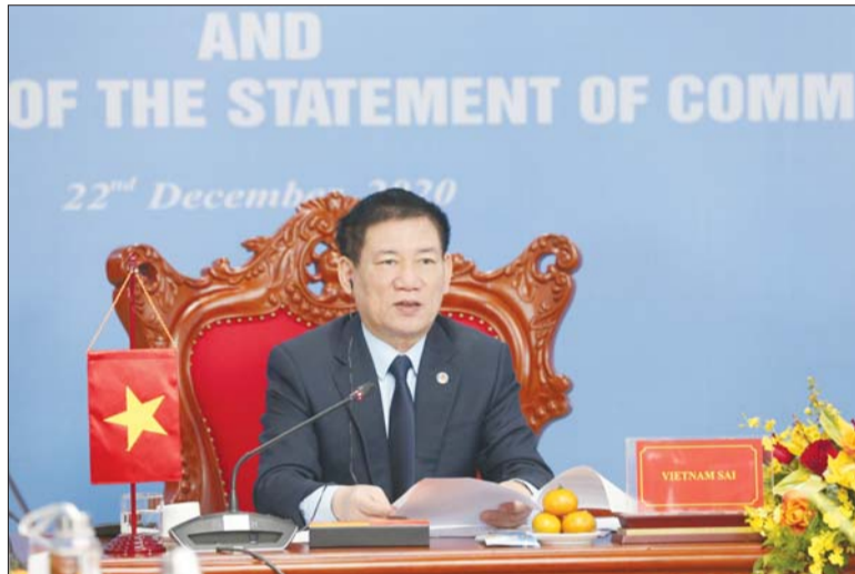
Tổng Kiểm toán Nhà nước Hồ Đức Phúc chủ trì cuộc họp trực tuyến

Cuộc kiểm toán hợp tác việc quản lý nguồn nước lưu vực sông Mê Công đã chính thức được khởi động. Việc triển khai cuộc kiểm toán không chỉ mang lại giá trị, lợi ích cho các cơ quan kiểm toán tối cao (SAI) tham gia mà còn góp phần thực hiện tốt các mục tiêu phát triển bền vững (SDGs) của Liên Hợp Quốc. Bởi vậy, công tác chuẩn bị cho cuộc kiểm toán được KTNN Việt Nam và các SAI tham gia hết sức quan tâm.