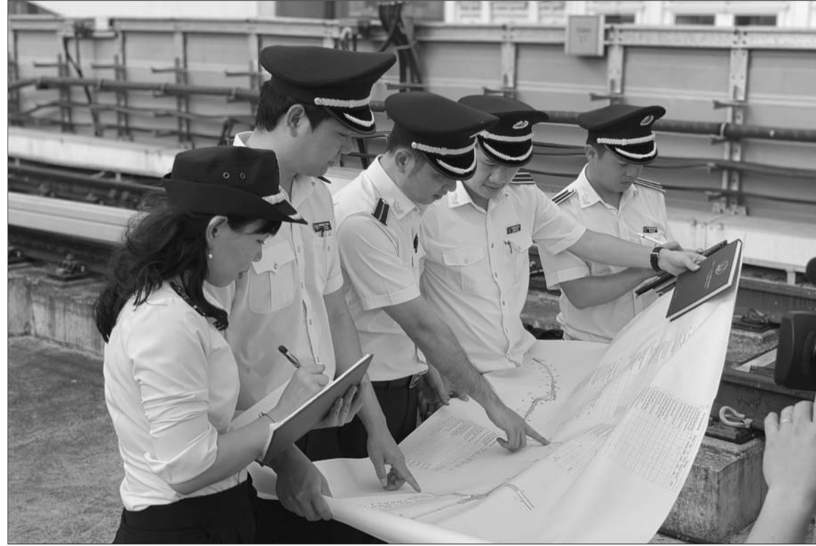
KTNN đã chỉ ra nhiều phát hiện kiểm toán đáng chú ý

Tóm lược kết quả kiểm toán hoạt động các chủ đề chính trong năm 2019, KTNN đã chỉ ra nhiều phát hiện kiểm toán đáng chú ý, đồng thời có những đánh giá, kết luận, kiến nghị kiểm toán quan trọng để các cơ quan, địa phương, đơn vị có liên quan chấn chỉnh, khắc phục.