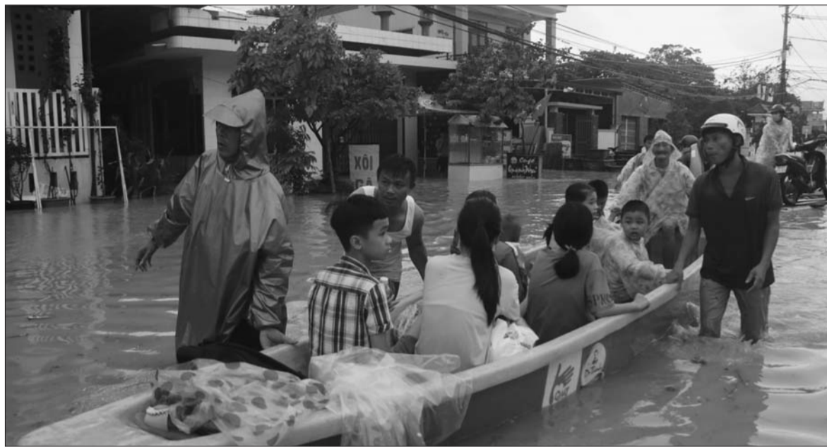
Việt Nam phải xử lý những thách thức về khí hậu và môi trường với tinh thần khẩn trương như đã làm với Covid-19

Trong Báo cáo điểm lại tình hình kinh tế Việt Nam công bố ngày 21/12, Ngân hàng Thế giới (WB) dự báo, năm 2020, trong khi kinh tế thế giới có thể suy giảm ít nhất 4% thì kinh tế Việt Nam sẽ tăng trưởng gần 3%. Tuy nhiên, Việt Nam nên tranh thủ cơ hội đang có để thực hiện cải cách về thương mại, chính sách tỷ giá và tài khóa... nhằm đạt được tốc độ tăng trưởng khoảng 6% trong năm tới.