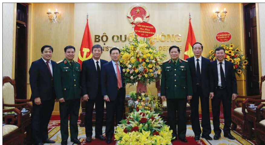
Đại tướng Ngô Xuân Lịch - Ủy viên Bộ Chính trị, Bộ trưởng Bộ Quốc phòng - tiếp Đoàn

Khẳng định công tác phối hợp giữa KTNN với các đơn vị của Bộ Quốc phòng đã được thực hiện rất tốt trong thời gian qua, Tổng Kiểm toán Nhà nước bày tỏ mong muốn mối quan hệ phối hợp đó sẽ ngày càng