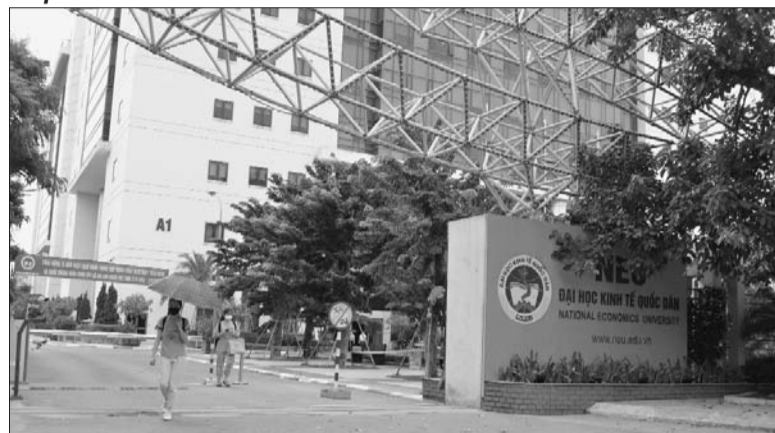
Tự chủ tài chính tại các cơ sở GDĐH là vấn đề đang tiếp tục được đặt ra để tìm giải pháp thực hiện hiệu quả

Tự chủ tài chính tại các cơ sở giáo dục đại học công lập (GDĐH) là vấn đề đang tiếp tục được đặt ra để tìm giải pháp thực hiện hiệu quả. Nhiều ý kiến cho rằng, Nhà nước cần mạnh dạn trao quyền cho các trường được vận dụng cơ chế tài chính như DN để tận dụng khai thác tốt các nguồn lực và phát triển.