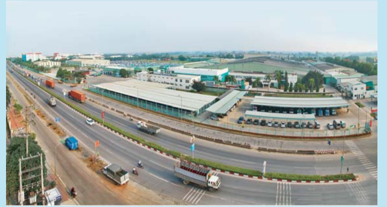
Khu công nghiệp Phúc Yên

Đặc biệt, Vĩnh Phúc là tỉnh đầu tiên trong cả nước triển khai phần mềm ứng dụng Bộ phận một cửa đồng bộ ở cả ba cấp, bảo đảm liên thông theo "chiều ngang", "chiều dọc" khi thực hiện giải quyết thủ tục hành chính và luôn nằm trong top 20 tỉnh, thành phố có điểm chỉ số cải cách hành chính cao nhất cả nước. Môi trường đầu tư, kinh doanh của tỉnh đã và đang được cải thiện; nhiều doanh nghiệp sản xuất kinh doanh hiệu quả, điều chỉnh tăng vốn, mở rộng quy mô sản xuất, đầu tư nâng cấp dây chuyền sản xuất, đổi mới mẫu mã, nâng cao chất lượng sản phẩm, mở rộng thị trường tiêu thụ như: Công ty TNHH Công nghiệp Chính xác Việt Nam I, Công ty TNHH BHFLEX Vina, Công ty Young Poong Electronics Vina... Qua đó góp phần giải quyết việc làm cho hơn 90.000 lao động, tăng thu