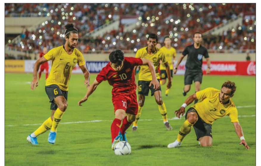
Cần hợp thức hóa hoạt động kinh doanh đặt cược thể thao nhưng phải có quy định quản lý chặt chẽ bằng pháp luật Ảnh minh họa