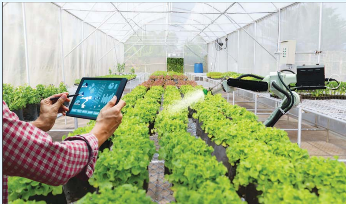
Các DN đang tập trung chuyển đổi số mạnh mẽ ở lĩnh vực nông nghiệp

Ngoài việc đầu tư công nghệ chế biến, chú trọng thị trường nội địa, chuyển đổi số được xem là “thang thuốc” hiệu quả cho nông nghiệp Việt Nam. Đây không chỉ như một xu thế ngắn hạn, mà là một hành trình xuyên suốt liên mạch để thay đổi bộ mặt nông nghiệp Việt Nam trong tương lai.