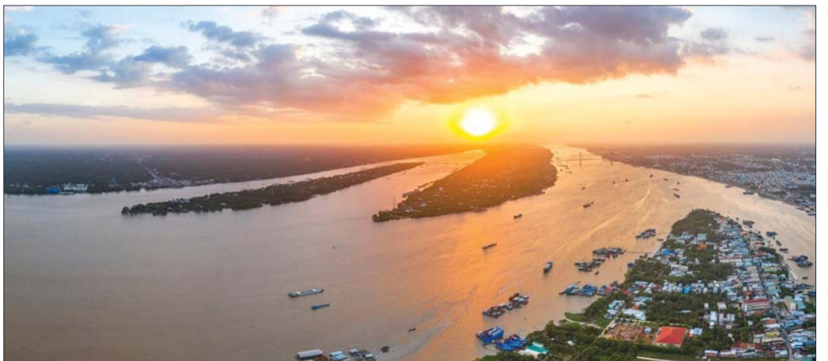
KTNN Việt Nam sẵn sàng, quyết tâm triển khai thành công cuộc kiểm toán hợp tác Ảnh minh họa

Trong vai trò chủ trì, KTNN Việt Nam đã thể hiện tinh thần sẵn sàng dẫn dắt các SAI triển khai cuộc kiểm toán qua Tuyên bố cam kết; đồng thời khẳng định tuân thủ các cam kết để đảm bảo rằng cuộc kiểm toán đạt được kết quả, mục tiêu đề ra. ■