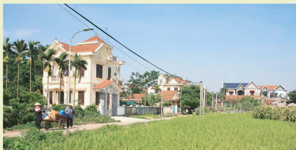
Thị trấn Thanh Lãng (huyện Bình Xuyên) ngày càng trù phú

Nhìn lại giai đoạn 2016-2019, tình hình kinh tế trong và ngoài nước có nhiều thuận lợi, do đó, kinh tế của tỉnh