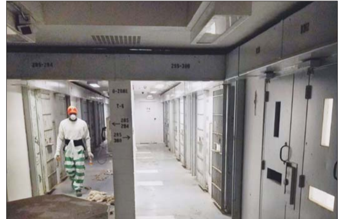
Nhà tù Parchman

Bên cạnh đó, những tài liệu quan trọng tại MDOC bao gồm nhiều chứng từ kế toán đã bị tiêu hủy khiến nhiều trường hợp chi tiêu ngân sách mờ ám chưa được làm rõ. Một số nhân viên của MDOC cho biết, những tài liệu đó bị mất hoặc vô tình bị hủy đi khi bị để lẫn vào hồ sơ loại, tuy nhiên, không ai có thể kiểm chứng được việc những tài liệu quan trọng có thể là bằng