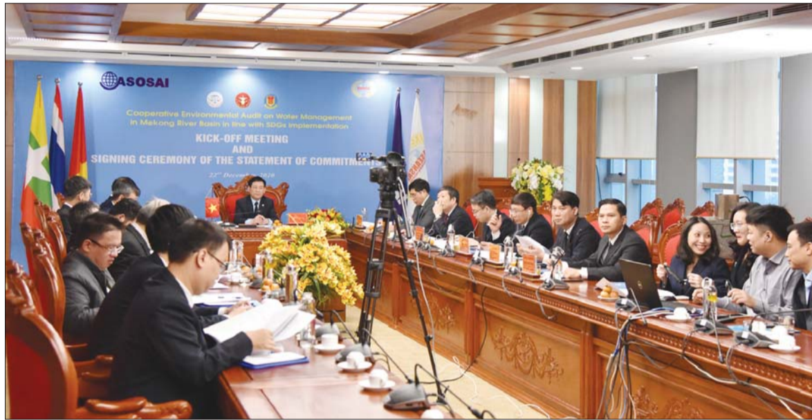
Quanh cảnh cuộc họp tại điểm cầu Việt Nam

Tinh thần hợp tác, trách nhiệm và quyết tâm cao trong triển khai cuộc kiểm toán hợp tác về quản lý nguồn nước sông Mê Công đã được Tổng Kiểm toán Nhà nước Hồ Đức Phớc - Chủ tịch Tổ chức Các cơ quan Kiểm toán tối cao châu Á (ASOSAI) nhiệm kỳ 2018-2021 - nhấn mạnh tại cuộc họp trực tuyến khởi động triển khai cuộc kiểm toán hợp tác này vào sáng 22/12, tại Hà Nội.