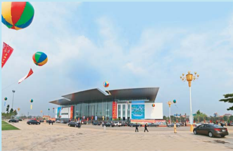
Vĩnh Phúc luôn tạo môi trường thông thoáng, thuận lợi cho hoạt động đầu tư

Thực hiện cơ cấu lại thu ngân sách theo hướng bao quát toàn bộ các nguồn thu, mở rộng cơ sở thu, nhất là các nguồn thu mới, giữ vững tỷ trọng thu nội địa cao, bảo đảm tỷ trọng hợp lý giữa thuế gián thu và thuế trực thu, khai thác tốt thuế thu từ tài sản, tài nguyên, bảo vệ môi trường./.