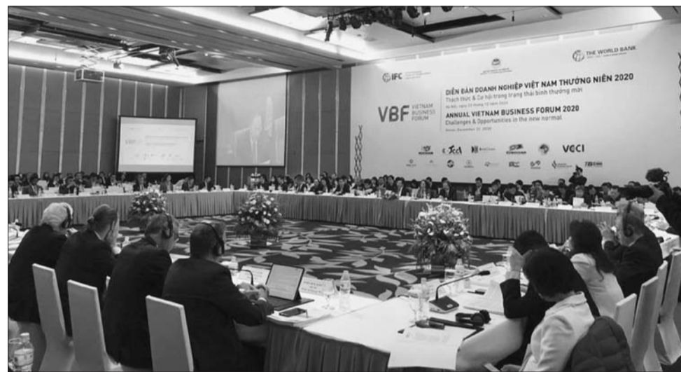
Quang cảnh Diễn đàn