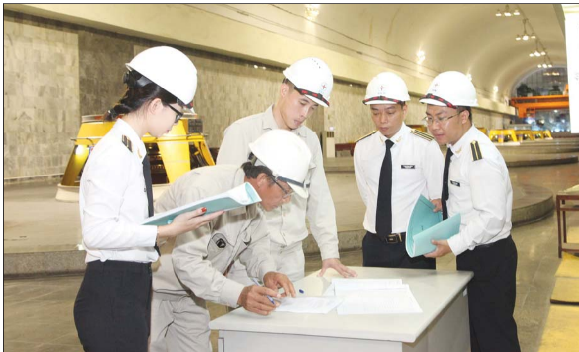
Việc triển khai thực hiện kiểm toán tổng hợp báo cáo quyết toán NSDP sẽ tăng cường tính khả thi của kiến nghị kiểm toán

chất lượng kiểm toán. Đồng thời sẽ tăng cường tính khả thi của kiến nghị kiểm toán, giảm thiểu khiếu nại, khiếu kiện đối với các kết quả kiểm toán và phù hợp với xu hướng, chiến lược phát triển của Ngành hiện nay và trong tương lai.