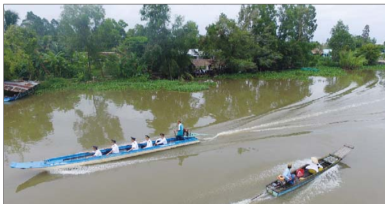
Dự kiến, từ tháng 3 - 5/2021, các SAI sẽ bắt đầu thực hiện Cuộc kiểm toán hợp tác

khóa đào tạo, tập huấn về: nguồn nước, kiểm toán môi trường, bằng chứng kiểm toán, lập kế hoạch kiểm toán cho cuộc kiểm toán, hướng dẫn thực hiện kiểm toán và lập báo cáo kiểm toán... sẽ được tổ chức với sự tham gia giảng dạy của các chuyên gia đến từ CAAF, các SAI Malaysia và Indonesia.